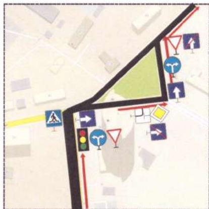
Схема учебного маршрута №2

Период действия с "01" 01 2024 г. по "01" 01 2025 г.