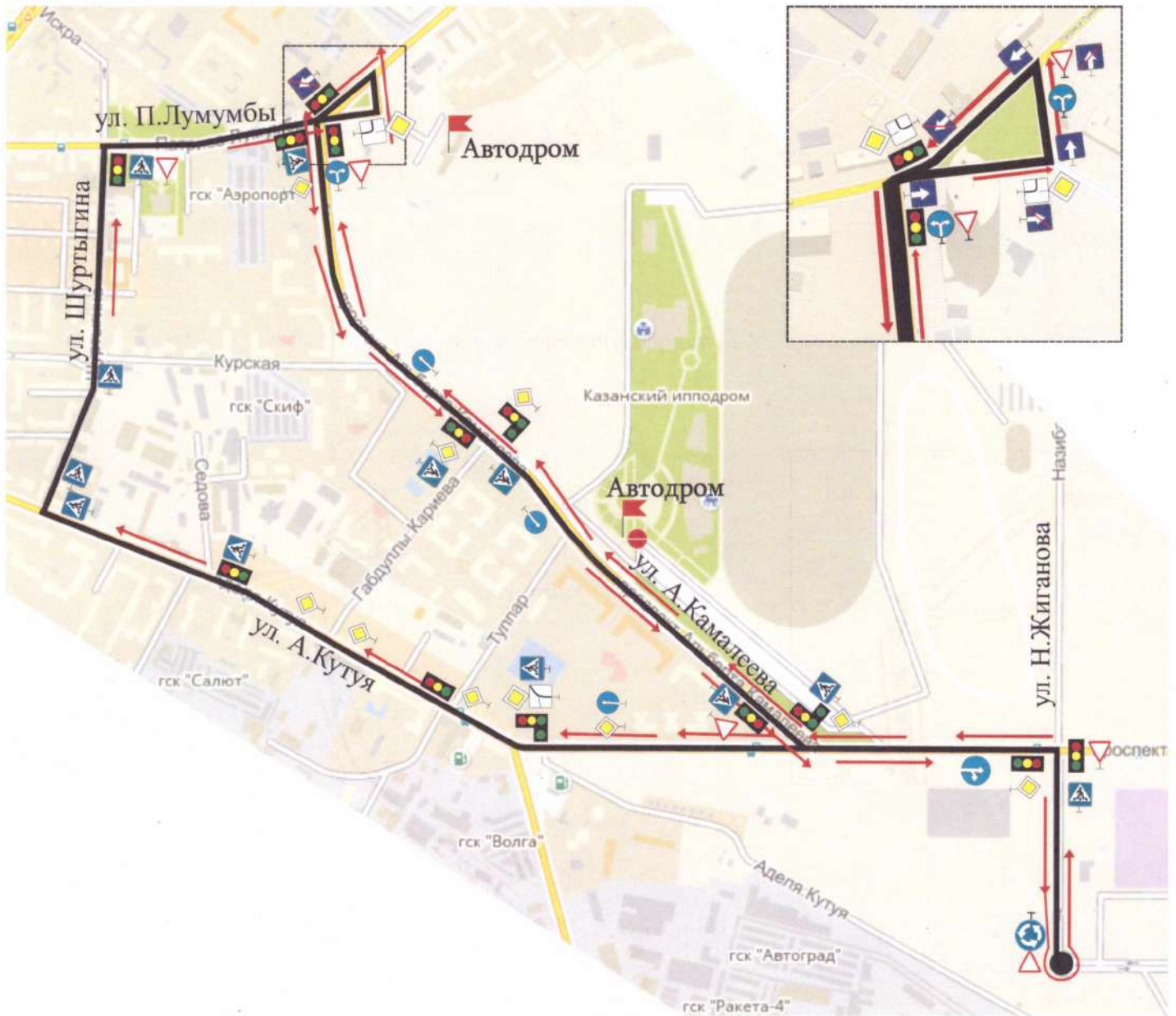
Схема учебного маршрута №3